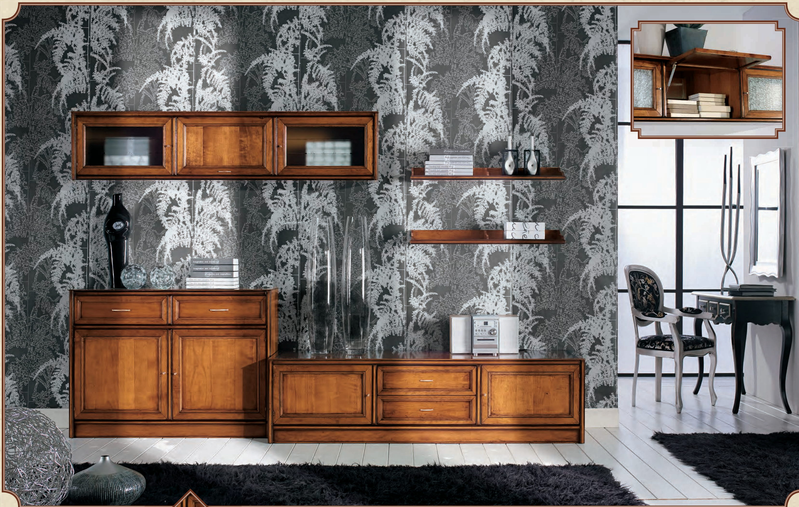
ART. 81 COMPOSIZIONE 81 L 319 • P 54 • H 200ca CM