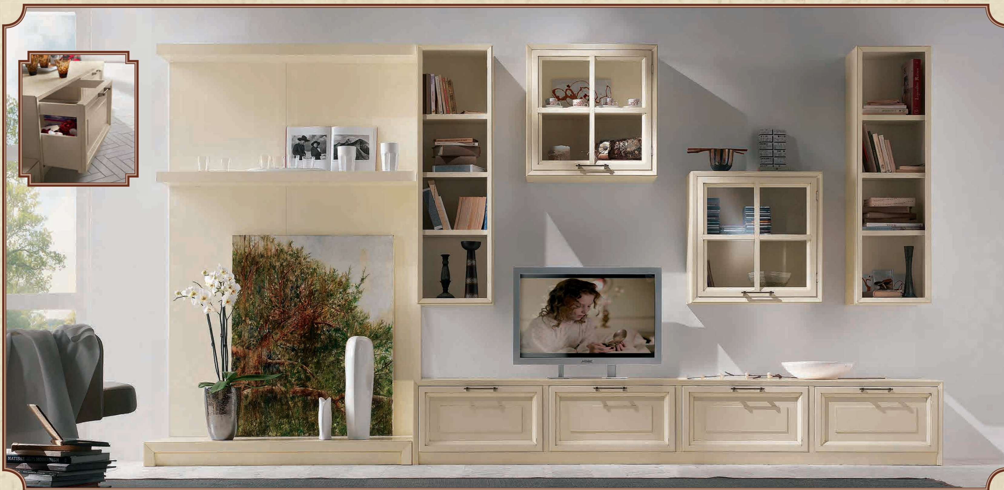
ART. 83 COMPOSIZIONE 83 L 370 • P 60 • H 198 CM