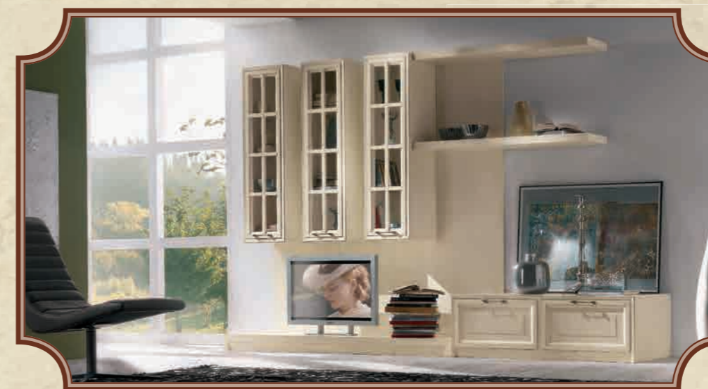
ART. 84 COMPOSIZIONE 84 L 310 • P 60 • H 198 CM