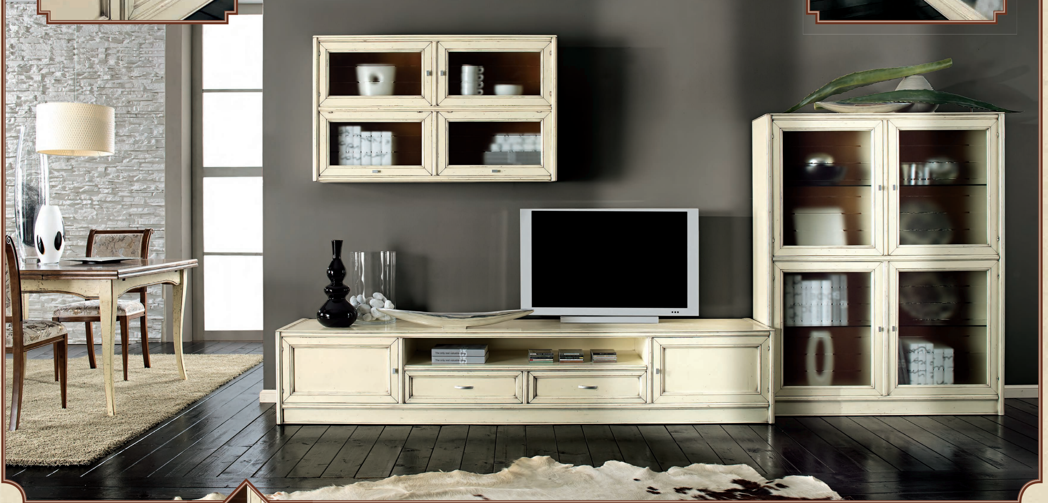
ART. 80 COMPOSIZIONE 80 L 380 • P 54 • H 200 CM