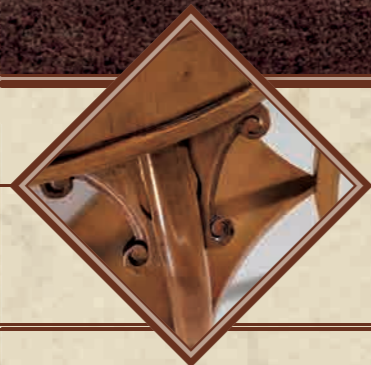
ART. 8629 SPECCHIERA OVALE L 78 • H 109 CM