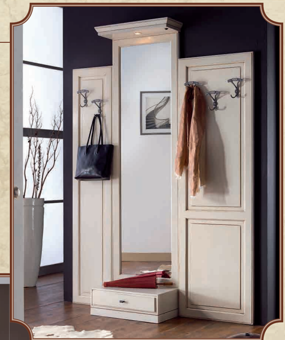
ART. 8617/6 CASSETTO A TERRA L.60 L 60 • P 35 • H 21 CM