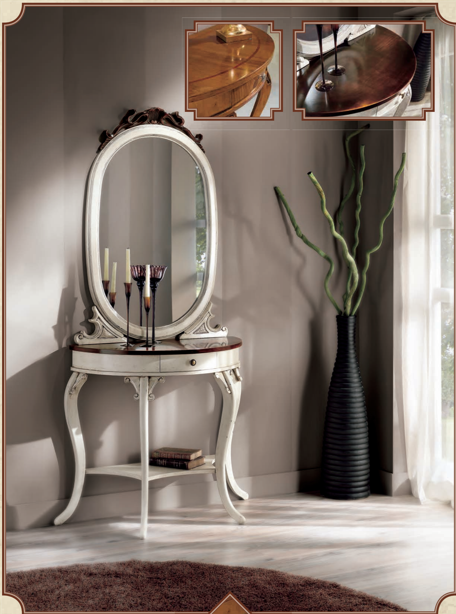
ART. 8628 CONSOLE SAGOMATA L 84 • P 41 • H 82 CM