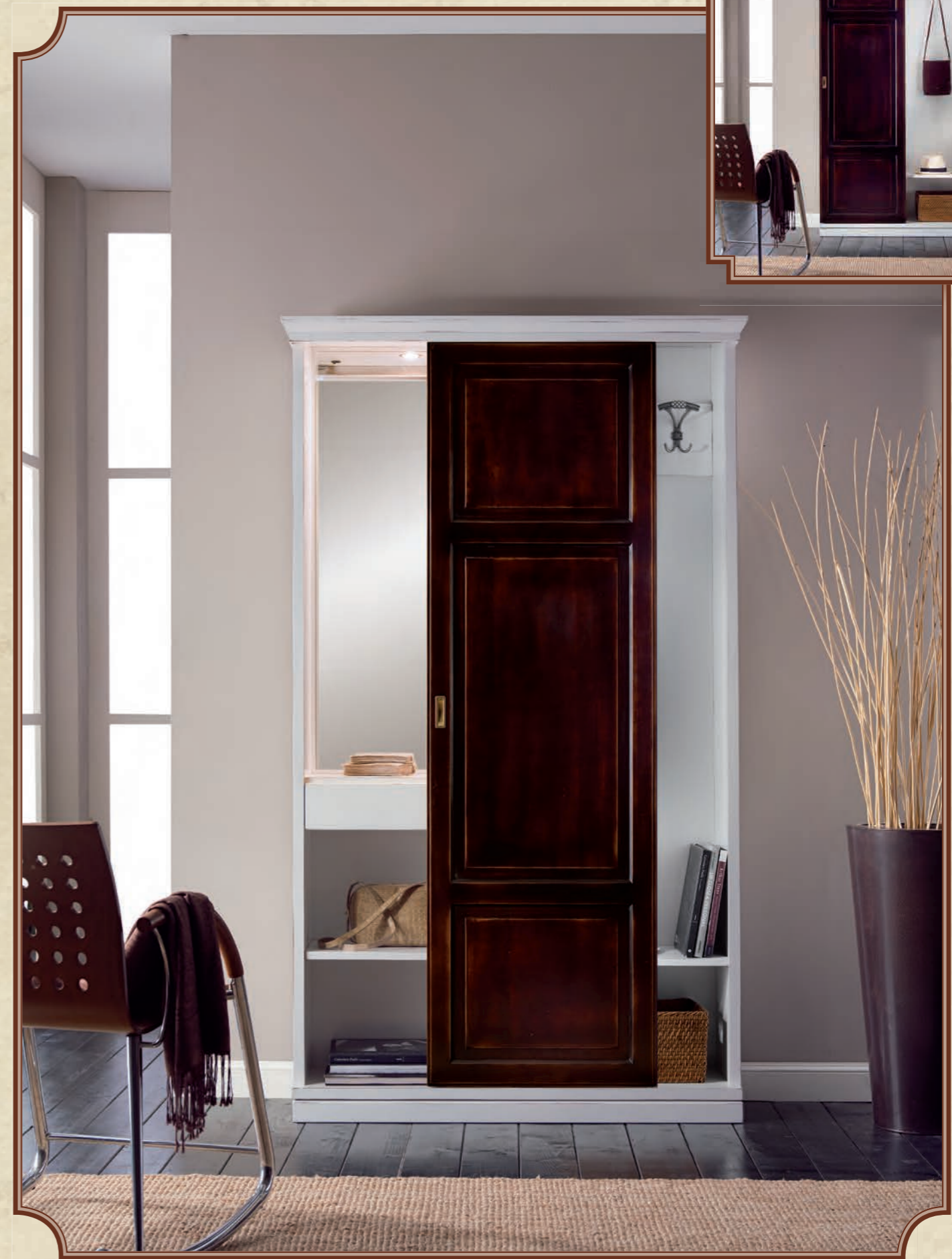
ART. 8623 COMPOSIZIONE INGRESSO SOLUZIONE COME DA FOTO L 123 • P 39 • H 212 CM