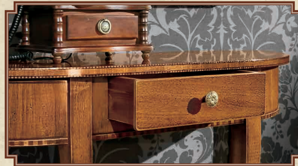
ART. 8636 CONSOLLE MEZZALUNA 1 CASSETTO CON SEGRETO L 105 • P 37 • H 77 CM