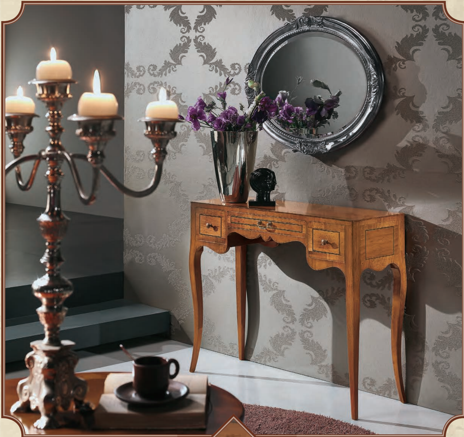
ART. 8634 CONSOLLE LASTRONATA IN NOCE, 3 CASSETTI L 100 • P 33 • H 80 CM