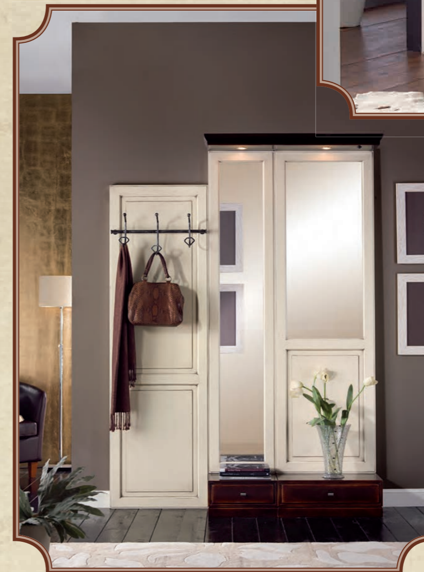
ART. 8618 APPENDIABITI 3 GANCI L 53,5