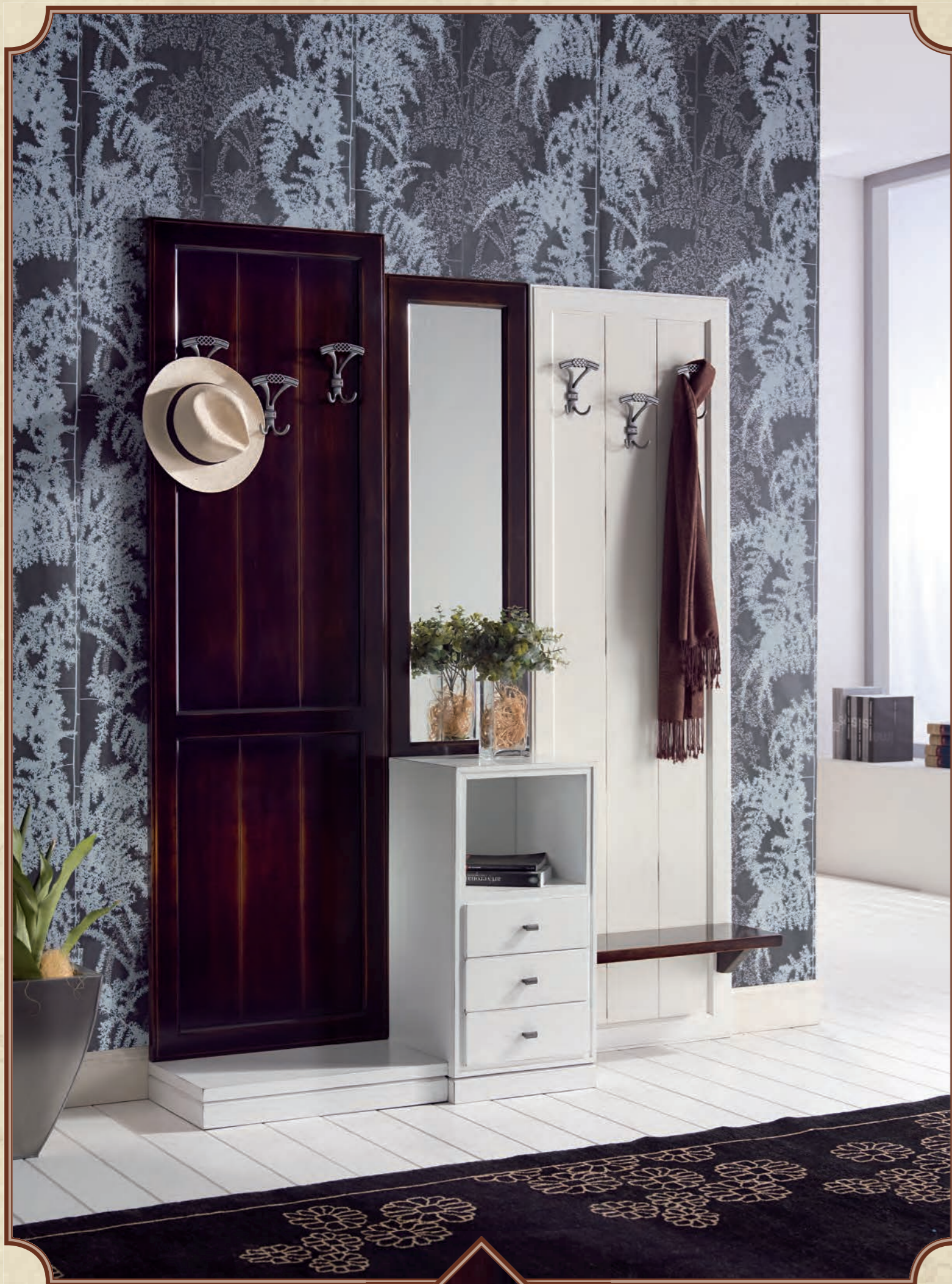
ART. 8614 COMPOSIZIONE INGRESSO SOLUZIONE COME DA FOTO L 160 • P 39 • H 205 CM