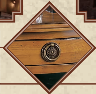
ART. 8632 CONSOLINA MEZZALUNA CILIEGIO MASSELLO L 85 • P 39 • H 75 CM