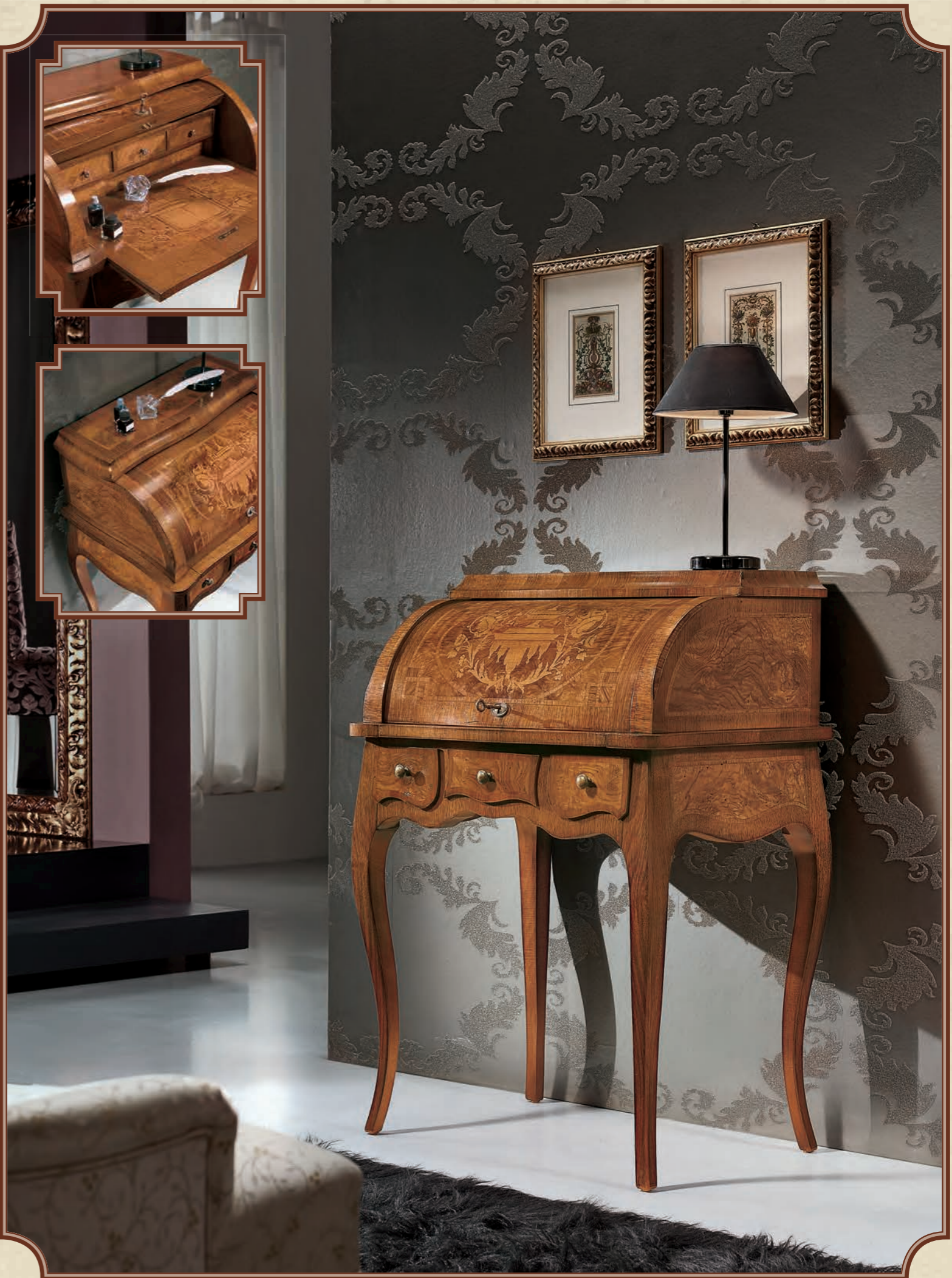
ART. 8627 BUREAU INTARSIATO NOCE FRASSINO L 72 • P 50 • H 102 CM