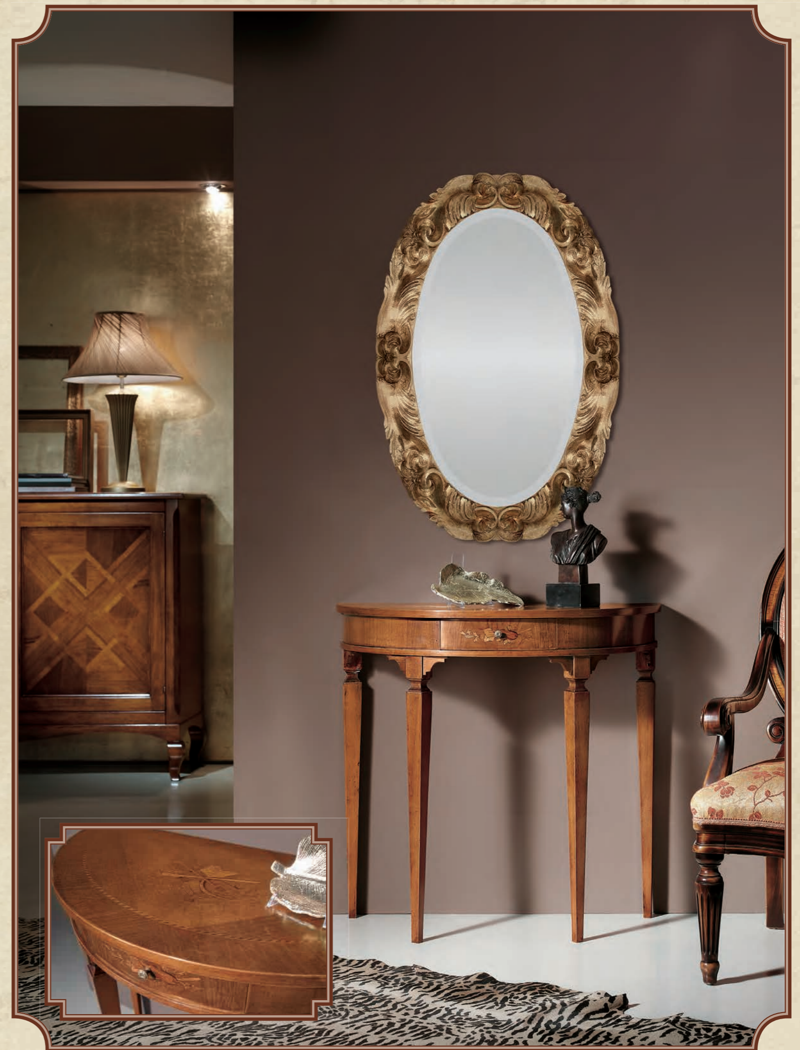
ART. 8630 CONSOLE MEZZALUNA CON INTARSIO L 84 • P 41 • H 82 CM