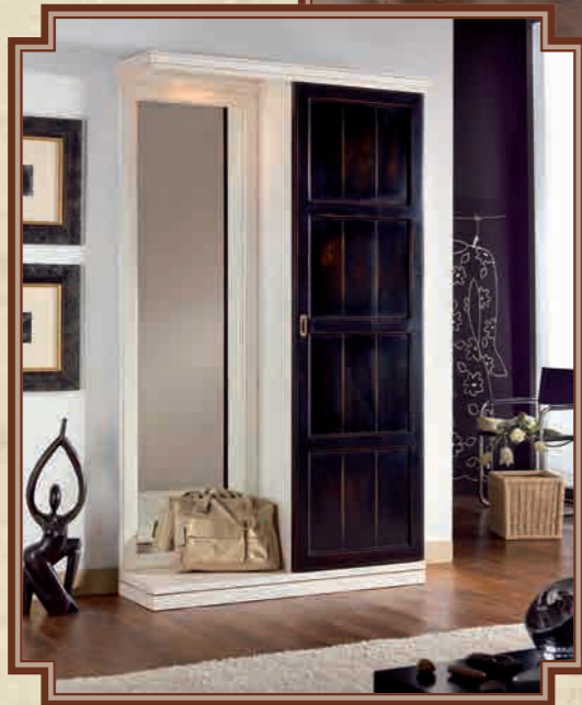
ART. 8622 COMPOSIZIONE INGRESSO SOLUZIONE COME DA FOTO L 126 • P 39 • H 212 CM