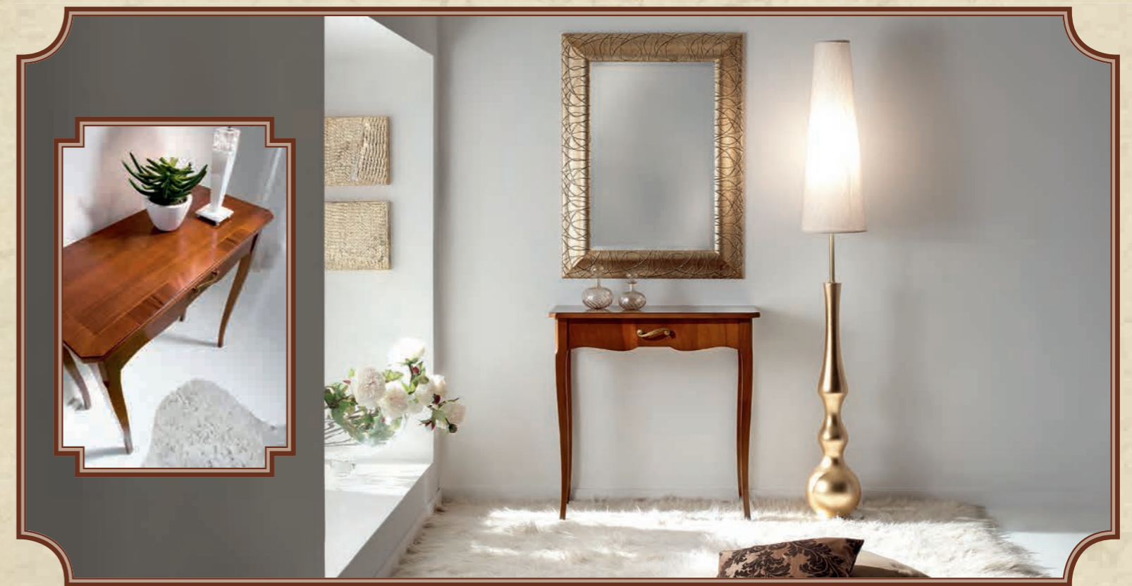
ART. 8640 CONSOLE 1 CASSETTO NOCE INTARSIATO L 79 • P 34 • H 80 CM