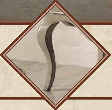
ART. 8626 BUREAU BOMBATO 2 CASSETTI L 105 • P 51 • H 114 CM