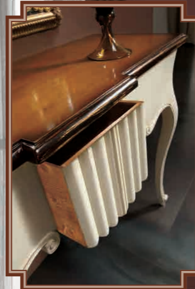
ART. 8633 CONSOLLE 1 CASSETTO L 125 • P 44 • H 86 CM